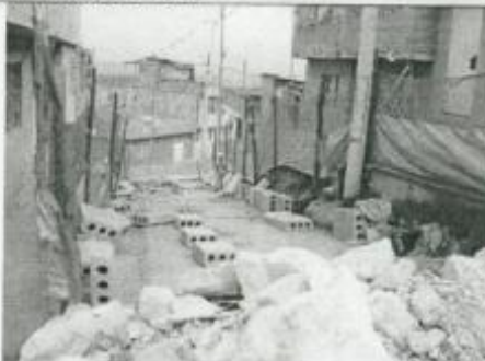
Visita Fiscal 15 de septiembre de 2009 Sin actividad en la obra