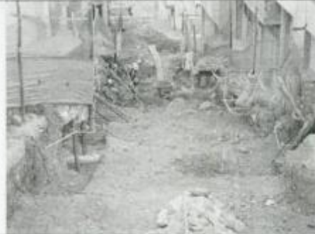
Visita Fiscal 15 de septiembre de 2009 Sin actividad en la obra