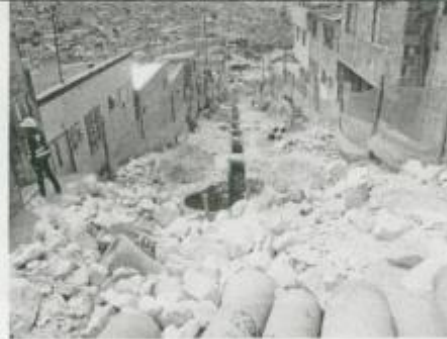
Visita Fiscal 28 de enero de 2010 - Con actividad baja en la obra

Carrera 45 B desde Calle 76 sur hasta calle 76 B sur