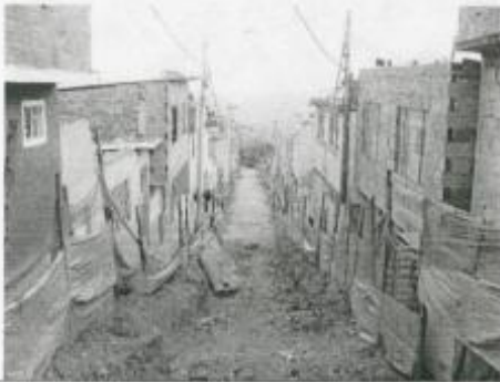
Visita Fiscal 15 de septiembre de 2009 Sin actividad en la obra

Calle 72G sur desde TV 18L hasta carrera 18M