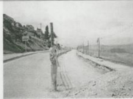
Visita Fiscal 28 de enero de 2010 - Con actividad baja en la obra