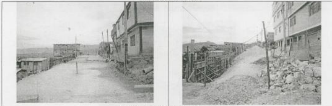
Visita Fiscal 28 de enero de 2010 Sin actividad en la obra