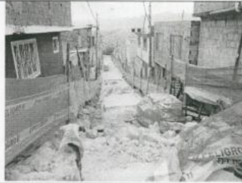
Visita Fiscal 28 de enero de 2010 Sin actividad en la obra