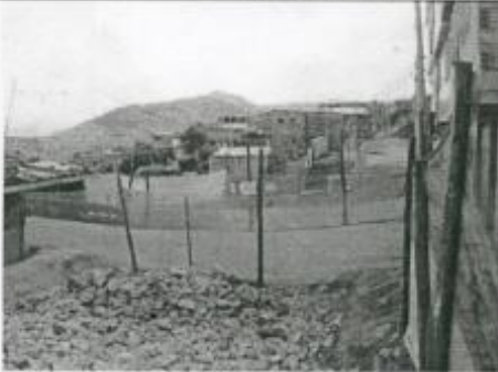
Visita Fiscal 15 de septiembre de 2009 Sin actividad en la obra

Calle 68 Bis sur desde carrera 18B Bis A hasta carrera 18D Bis A