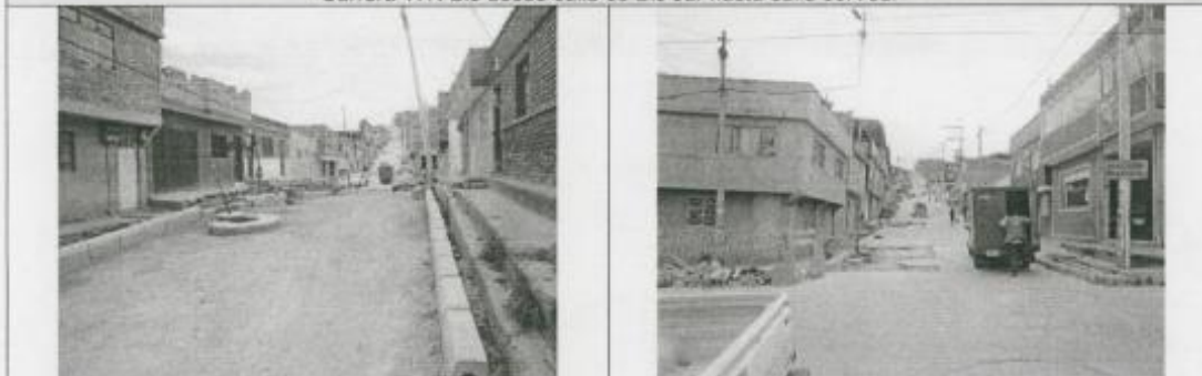
Visita Fiscal 28 de enero de 2010 - Sin actividad en la obra