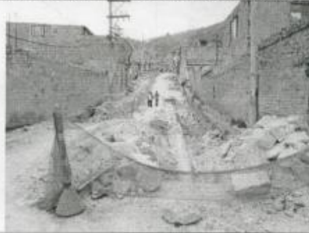
Visita Fiscal 28 de enero de 2010 Sin actividad en la obra

Carrera 18 I desde Transversal 18 H hasta calle 78 A Bis sur