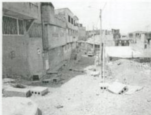
Visita Fiscal 28 de enero de 2010 Sin actividad en la obra