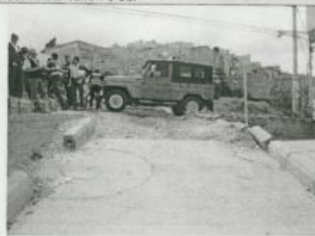
Visita Fiscal 28 de enero de 2010 Sin actividad en la obra