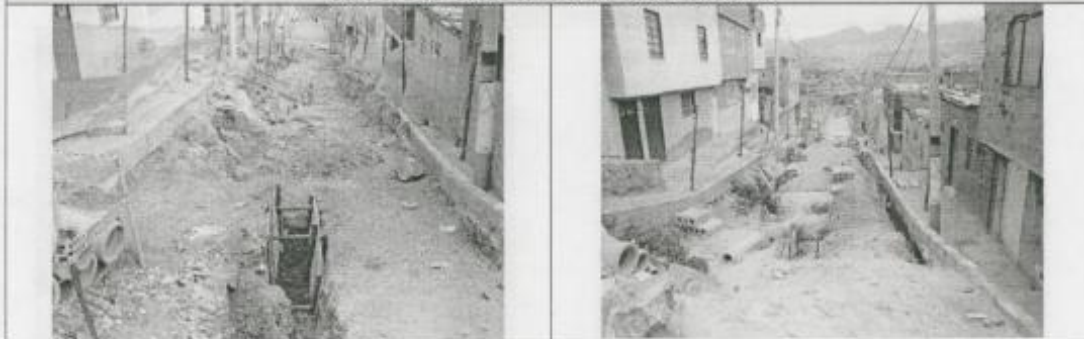
Visita Fiscal 15 de septiembre de 2009 Sin actividad en la obra